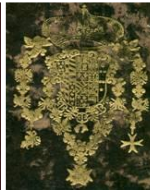
Przykłady typowych XV i XVI wiecznych superexlibrisów.