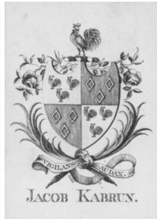
Typowe XV wieczne exlibrisy